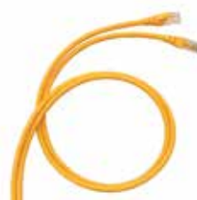
6 328 78