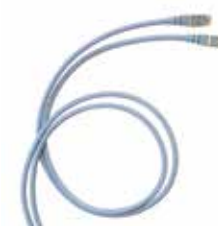
6 328 86