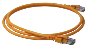
6 328 87